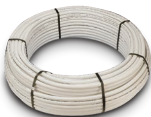
Tubería PEX/AL/PEX en Rollo - PEX/AL/PEX Multilayer Pipes - Tubes Multicouche PEX/AL/PEX