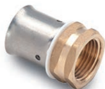
Racor Fijo Rosca Hembra - Fixed Fitting with Female Thread - Raccord Femelle Fixe