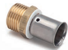
Racor Fijo Rosca Macho - Fixed Fitting with Male Thread - Raccord Mâle Fixe