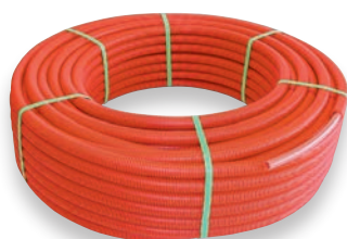
Tubería Forrada con Corrugado (PEX/AL/PEX) - Pipe in Pipe - Tubes Pregainés