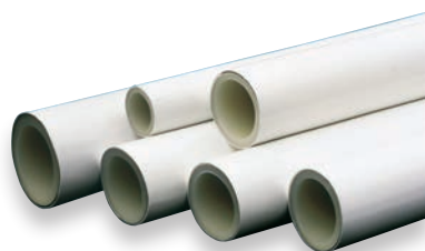
Tubería PEX/AL/PEX en Barra - PEX/AL/PEX Pipes in bars - Tubes en barre PEX/AL/PEX